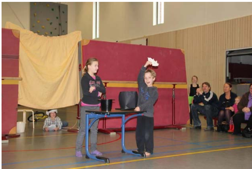
Wij zijn trots op onze voorstelling

Ieder thema begint met verschillende startactiviteiten aan de hand van materialen, boeken en dergelijke, zodat de kinderen zich kunnen oriënteren op het nieuwe thema. Vervolgens ontstaat het lesaanbod mede op basis van vragen rondom het thema die vanuit de kinderen komen. Hierna volgt een periode van verbreding en verdieping binnen het thema. Een excursie/uitstapje en een gast in de klas (een deskundige die veel kan vertellen over het thema) zorgen voor een koppeling naar de 'echte wereld'. Aan het einde van het thema wordt toegewerkt naar een afsluiting in de vorm van bijvoorbeeld een tentoonstelling of voorstelling. Bij de afsluiting worden de ouders/verzorgers vaak uitgenodigd op school.