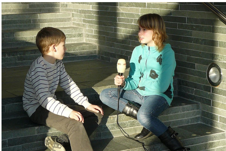
Als journalist aan de slag in de Meerwerkgroep