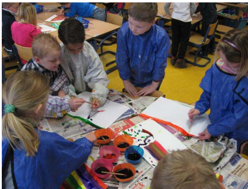
Uit de kunst!

In groep 1 t/m 5 passen deze activiteiten in het thema dat aan de orde is. In de bovenbouw proberen we alle creatieve activiteiten zoveel mogelijk aan te laten sluiten bij de andere vakken.