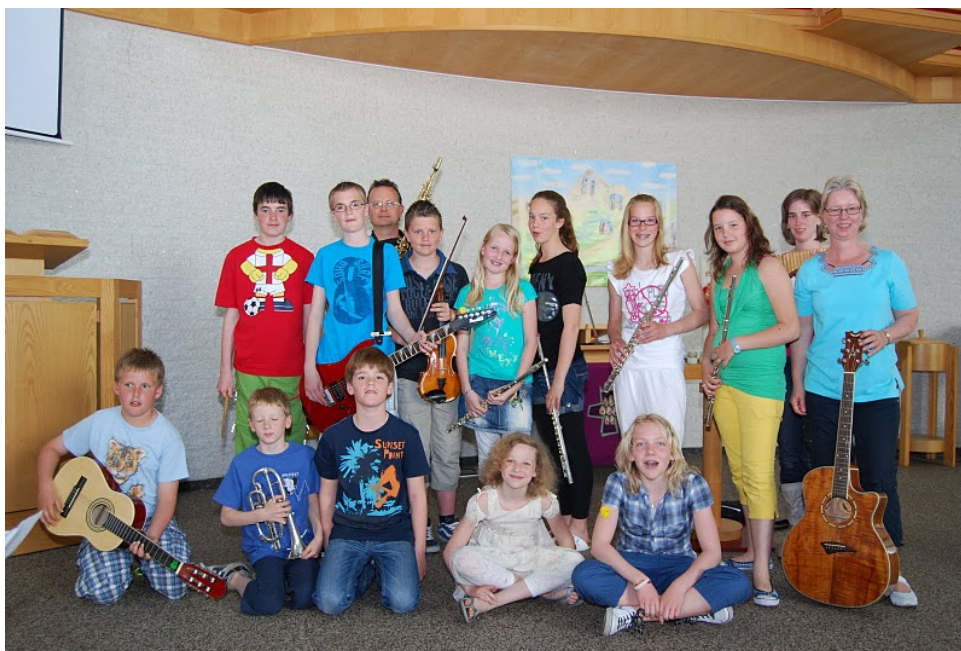
Wij zijn trots op het schoolorkest van de Ackerweide!

Cbs Ackerweide heeft een eigen schoolorkest waar meesters, juffen en kinderen aan deelnemen. Dit schoolorkest speelt muziek tijdens de schoolkerkdienst, de kerstviering en de paasviering. Ook bij een speciale gelegenheid, zoals een jubileum, kan het schoolorkest worden ingezet.