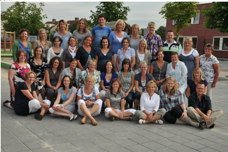
Team CBS Ackerweide

Ook de compensatieverlofdagen (voorheen ADV) proberen we zo in te plannen, dat het voor de kinderen zo vertrouwd mogelijk verloopt. In de groepen 1 t/m 4 nemen de leerkrachten hun compensatieverlof op vrijdagmiddagen op; op die manier hoeven er geen leerkrachtwisselingen plaats te vinden.