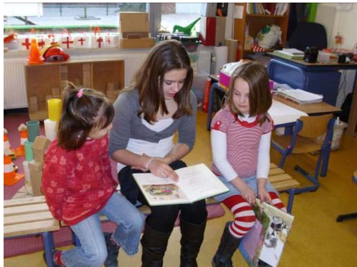
We helpen en troosten elkaar