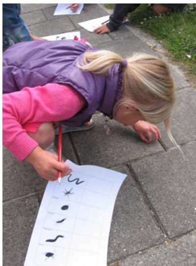
Dit kriebelbestje komt in mijn portfolio

In groep 1 t/m 4 krijgen de kinderen twee rapporten onder de naam 'Stand van Zaken' in de perioden rond januari en juni. In groep 3 en 4 wordt daarbij een aanvullend verkort rapport gegeven, waarin bepaalde toetsresultaten zijn vermeld. Alle kinderen van groep 1 t/m 4 hebben ook een portfolio, waarin schoolwerk wordt bewaard en waaruit hun ontwikkeling is af te lezen.