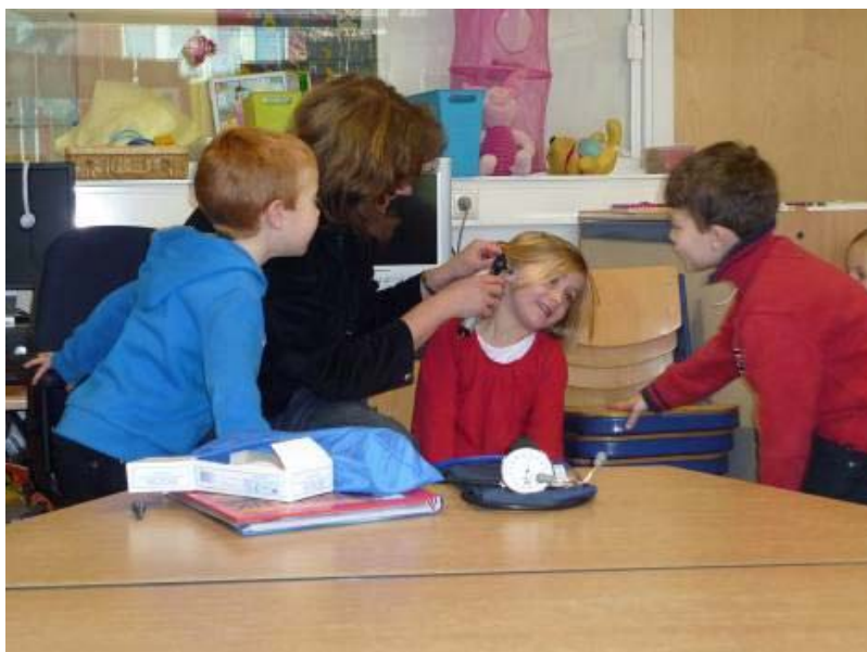
Een dokter in de klas: kijk je ogen uit!

Onderzoek heeft daarin vooral nog een spelkarakter. Kinderen experimenteren en gaan op onderzoek uit binnen de kernactiviteiten. Daarnaast vormen uitstapjes en gasten in de groep prima mogelijkheden om ervaringen op te doen met gericht onderzoek, vragen stellen en iets te weten willen komen. Een opmaat voor onderzoeksactiviteiten die in de bovenbouw dan de 'leidende activiteit' worden.