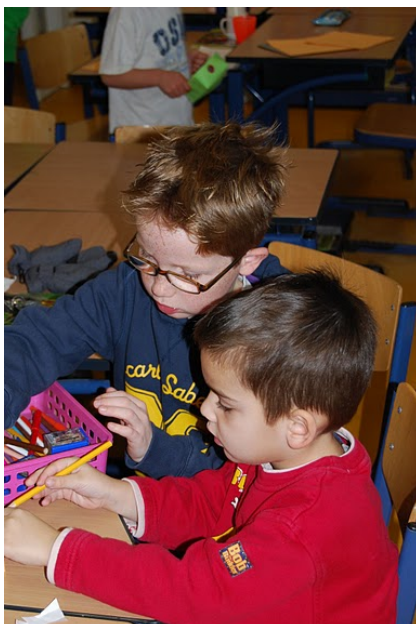
Leren met en van elkaar

Vierjarigen en kinderen die door verhuizing op school willen komen, worden in principe altijd aangenomen. Uitzondering op deze regel wordt gemaakt voor kinderen waar een advies ligt voor een plaatsing in het speciaal onderwijs. Deze aanmeldingen worden apart bekeken. Instroom vanuit andere basisscholen in Pijnacker kan pas plaatsvinden, nadat overleg is gevoerd met de school waar de kinderen vandaan komen.